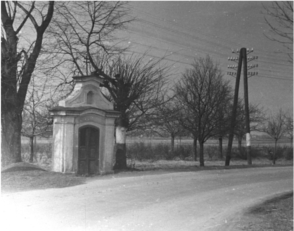
Kaple sv. Václava na historickém snímku ze 60. let.