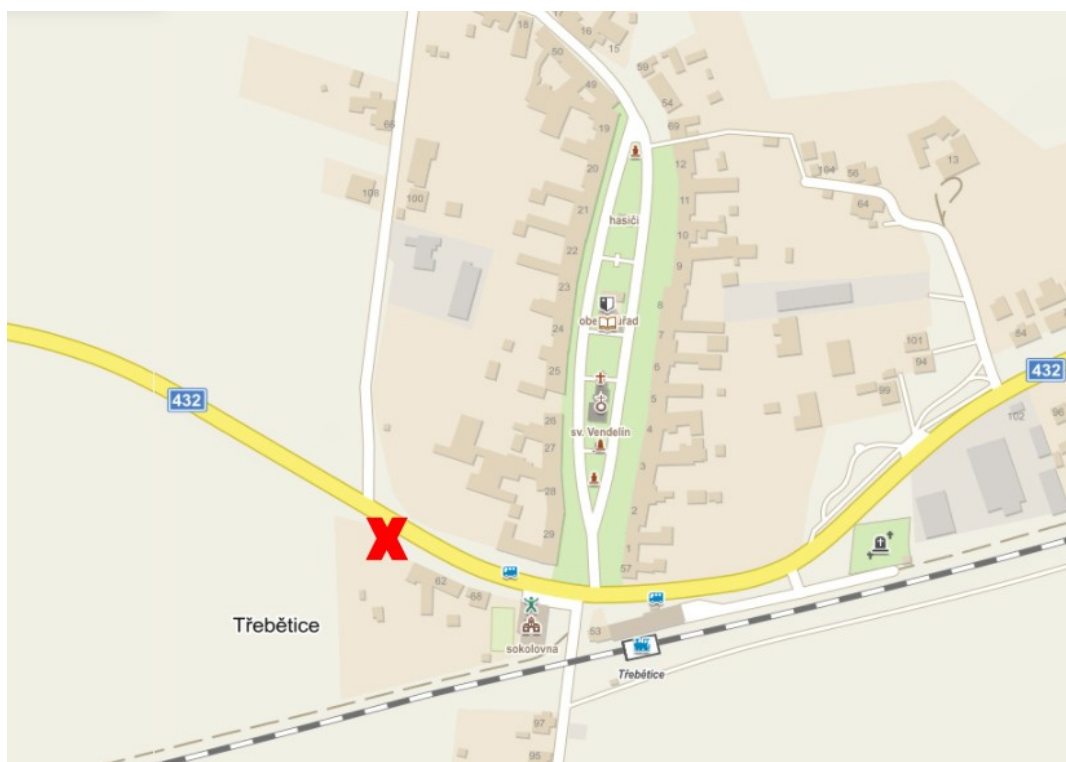
Poloha kaple na současné mapě

Status: kulturní památka č. ÚSKP 52228/7-6177 Chráněno 3.5.1958 – 19.8.1983.